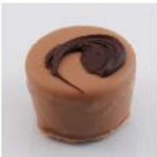
0030 Apricot Brandy Zachte amandel- marsepein met apricot brandy