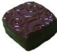
0146 Arabesque Zachte pure vulling met mokkaçrème