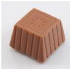
0011 Butterscotch Zachte vulling met Butterscotch