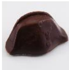
0124 Chapeau Napoleon