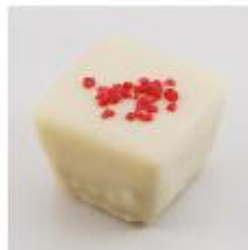
0168 Hibiscus Zachte witte vulling met hibiscussiroop