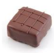
0041 Koffie Carree Pure vulling met koffie