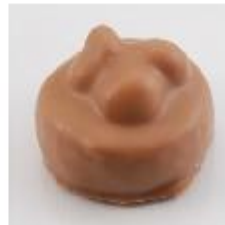
0059 Trois frères Melk gianduja met drie hele hazelnoten