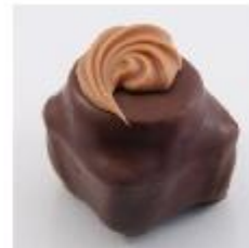
0014 Canache Zachte vulling met koffie en plakje pure gianduja