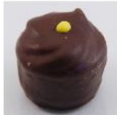
0029 Advocaat cuvette Zachte vulling met advocaat en roomchocolade rozet