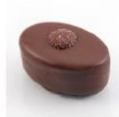
0018 Marijke Zachte vulling met advocaat