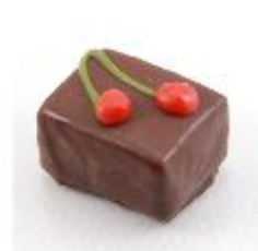
0055 Wilde kers

Zachte vulling met Blue Curacao met wafelbodem