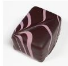
714 Wild cherry Zachte vulling met wilde kers