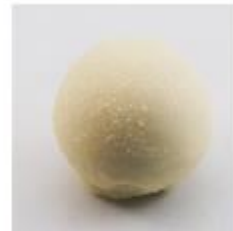
0026 Champagnekogel Zachte vulling met Champagne