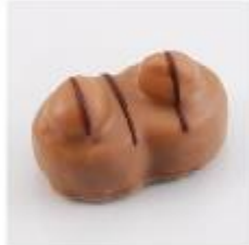
0128 Montana Melk hazelnoot- gianduja met hele hazelnoot