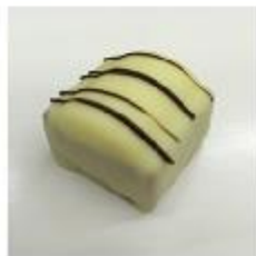
701 Vanille krokant Krokante bodem van feulletine met vanillecrème