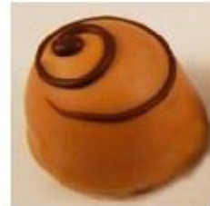
700 Cappuccino melk Witte roomcrème met cappuccino