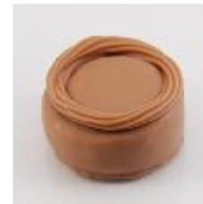
0050 Valencia Melk gianduja met plakje nougat