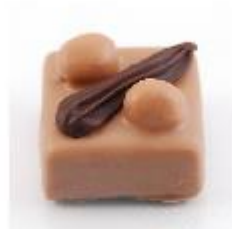
0040 Hazelino Hazelnootgianduja met twee hele hazelnoten