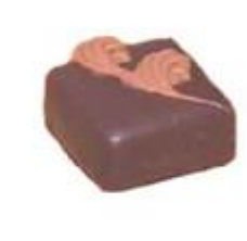
0042 Krokant Amandelmarsepein met stukjes nougat en hazelnoot