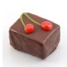
0055 Wilde kers Zachte vulling van wilde kers