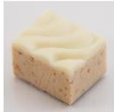
0054 Praliné wit Witte hazelnoot- gianduja