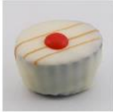
0028 Cherry Brandy Zachte vulling met cranberry