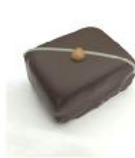
709 Roasted Almond Blokje van marsepein, amandelspijs en stukjes walnoot