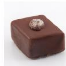
0039 Gember Pure gianduja met stukjes gember