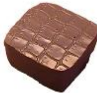
0147 Crocodile Amandelmarsepein met melk gianduja