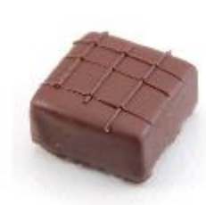
0041 Koffie carree Pure vulling met koffie