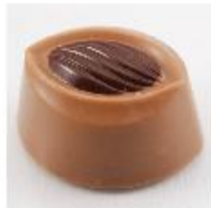
0131 Tia Maria