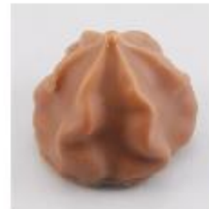
0010 Hazelnoot Rozet Melk roomcrème met hazelnoot