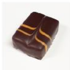
716 Mango Fruitblokje van mango