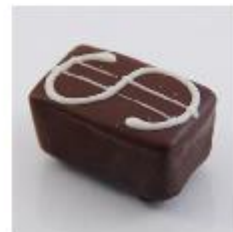
0022 Amaretto Zachte vulling met Amaretto