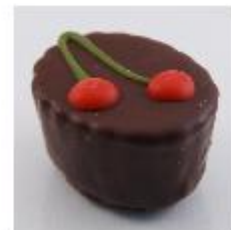
0021 Amarene Zachte vulling van amarene met hele amarenekers