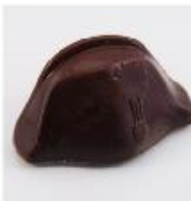
0124 Chapeau Napoleon Zachte vulling met Mandarine Napoleon