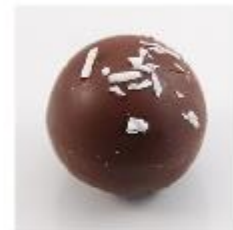
289 Cocoskogel Zachte witte vulling met Malibu