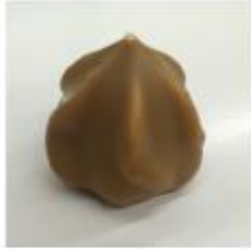
708 Licor 43 rozet Witte roomcrème met Licor 43