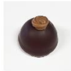
712 Marasquin puur Witte roomcrème met Marasquin