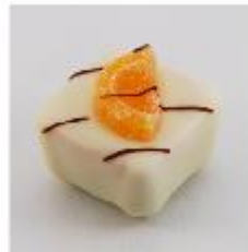
0025 Orange Zachte vulling met Cointreau en stukjes sinaasappel