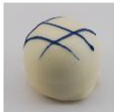
0125 Curacao Zachte vulling met Blue Curacao met wafelbodem