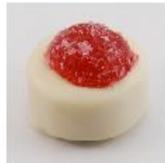
0045 Paris Amandelmarsepein met stukjes hazelnoot