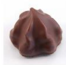
0004 Grand Marnier Pure roomcrème met Grand Marnier