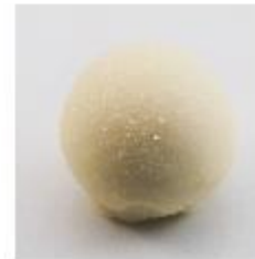
0026 Champagnekogels Zachte vulling met Champagne