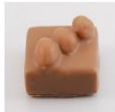
0049 Trio Melk gianduja met drie hele hazelnoten