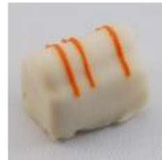
0056 Arancio Amandelmarsepein met stukjes sinaasappel en sinaasappelcrème