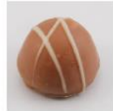
0007 Pallet Witte roomcrème met Marasquin