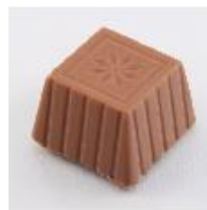
0011 Butterscotch Zachte vulling met Butterscotch