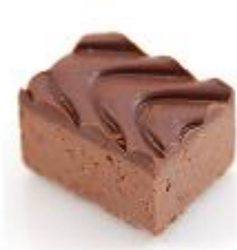
0053 Praliné puur Pure hazelnoot- gianduja