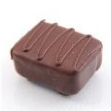
0015 Carola Zachte vulling met ambachtelijke caramel