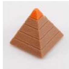
0148 Luxor Zachte vulling met Passoa en cocos