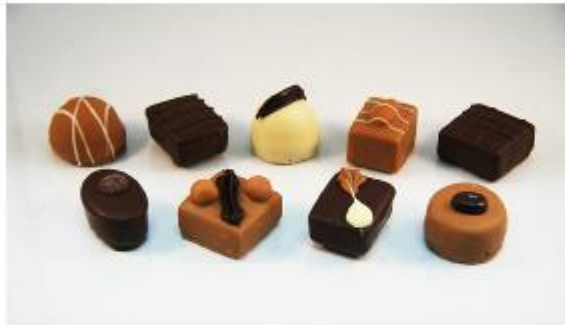
0077 De Luxe