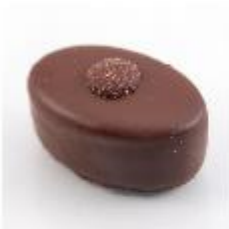
0018 Marijke Zachte vulling met advocaat