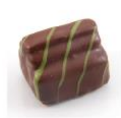
0047 Pistache Melk gianduja met pistachecrème