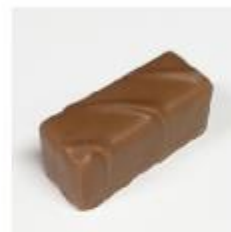
707 Noisette Melk hazelnoot- gianduja