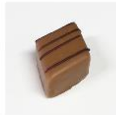
718 Mandorla Zachte amandelvulling