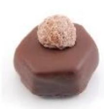
0057 Izmir Melk hazelnoot- gianduja met hazelnoot