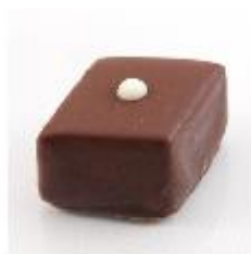
228 Amandelruit Pure gianduja met amandel