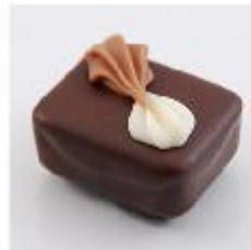
0013 Ascona Zachte vulling met sinaasappel