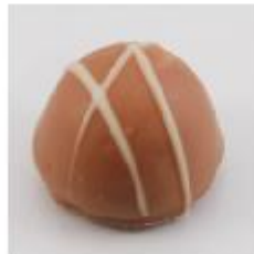
0007 Pallet Witte roomcrème met Marasquin