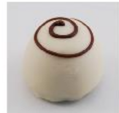
0123 Cappuccino Witte roomcrème met cappuccino