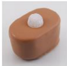
0016 Cointreau Zachte vulling met Cointreau