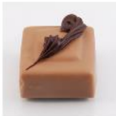
0044 Nogatine Melkvulling met plakje nougat