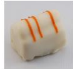
0056 Arancio Amandelmarsepein met stukjes sinaasappel en sinaasappelcrème