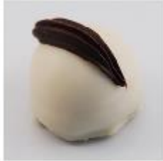
0001 Brasil Witte roomcrème met Irish coffee