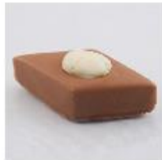
0058 Almond Melk amandelgianduja met chocolade amandel