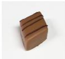
718 Mandorla Zachte amandel- vulling