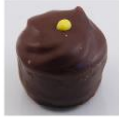
0029 Advocaat cuvette Zachte vulling met advocaat en roomchocolade rozet