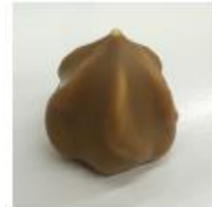
708 Licor 43 rozet Witte roomcrème met Licor 43