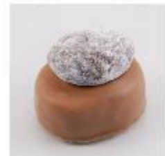
0127 Mondoria Melk hazelnootgianduja met chocolade sneeuwamandel