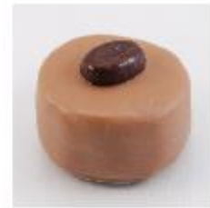
0035 Congo Melk hazelnootgianduja met koffiegranulaat