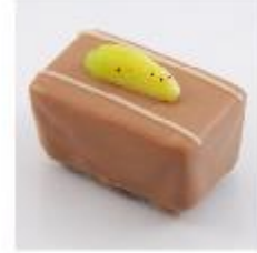
0031 Bahama Zachte vulling met banaan