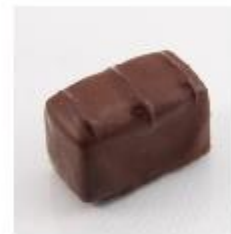
213 Sinaasstaafje Pure gianduja met sinaasappel