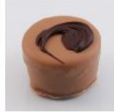
0030 Apricot Brandy Zachte amandel- marsepein met apricot brandy