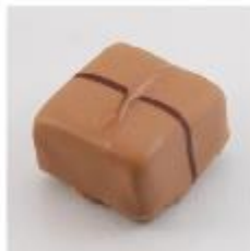
0166 Five spice Pure snijganache met five spice kruiden