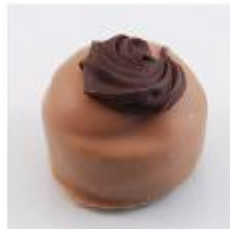
0012 Beerenburg Witte roomcrème met Beerenburg