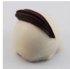
0001 Brasil Witte roomcrème met Irish coffee