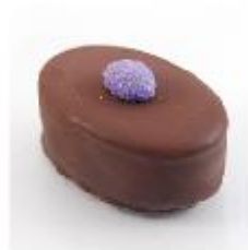
0017 Gianduja Zachte hazelnoot- vulling met nougatgranulaat