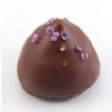
0005 Kirschpunt Pure roomcrème met Kirsch