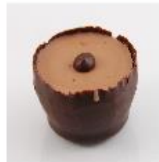
Amaretto cuvette Zachte vulling met Amaretto