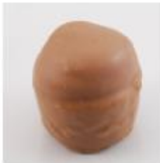
0019 Rumcups Pure roomcrème met rum en rumrozijnen