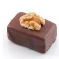
0034 Cerneaux Pure vulling met stukjes walnoot