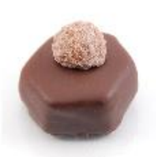
0057 Izmir Melk hazelnoot- gianduja met hele chocolade hazelnoot