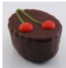
0021 Amarene Zachte vulling van amarene met hele amarenekers