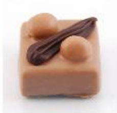
0040 Hazelino Hazelnootgianduja met twee hele hazelnoten