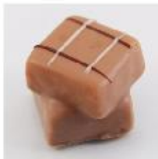
0036 Duplo Amandelmarsepein met melkvulling