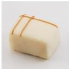
0048 Sylvia Amandelmarsepein