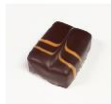
716 Mango Fruitblokje van mango