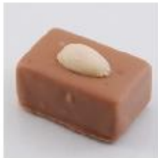
0032 Amandine Witte amandel gianduja