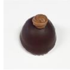
712 Marasquin puur Witte roomcrème met Marasquin