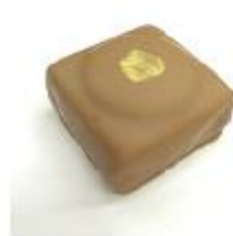
715 Coffee caramel Snijganache met romige caramel en nougatplakje