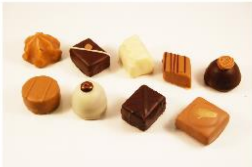
0285 Assortiment Royal B