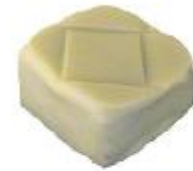
0145 Tressee Amandelmarsepein met stukjes pistache