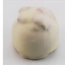
0003 Dressenoix Pure roomcrème met hele walnoot