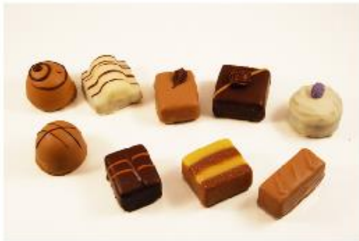
0284 Assortiment Royal A