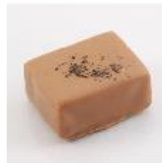
288 Jasmijn Melk snijganache met groene jasmijnthee