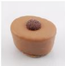
0023 Kaneel Zachte vulling met kaneel