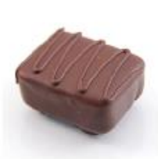
0015 Carola Zachte vulling met ambachtelijke caramel