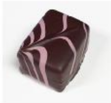
714 Wild cherry Zachte vulling met wilde kers