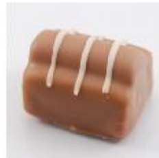
0033 Castor Amandelmarsepein met rumcrème