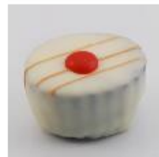
0028 Cherry Brandy Zachte vulling met cranberry