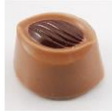
0131 Tia maria Zachte vulling met Tia Maria