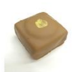
715 Coffee caramel Snijganache met romige caramel en nougatplakje