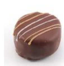
0046 Picasso Pure gianduja met nougatgranulaat