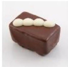
0020 Whisky Zachte vulling met Whisky