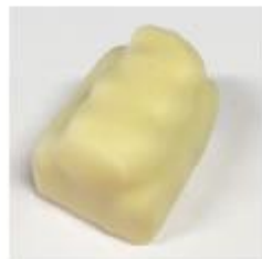
717 Naranja Marsepein met stukjes sinaasappel en sinaasappelcrème