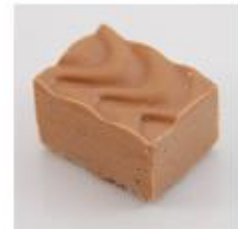
0052 Praliné melk Melk hazelnootgianduja