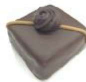
703 Crispy Melk hazelnoot- gianduja met gepofte rijst