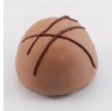
0002 Cognactips Pure roomcrème met Cognac