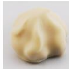
0009 Cointreau Rozet Witte roomcrème met Cointreau