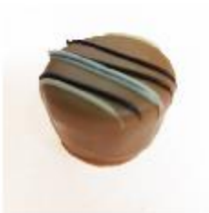
203 Caramelrondje Zachte vulling met ambachtelijk caramel