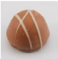
0007 Pallet Witte roomcrème met Marasquin