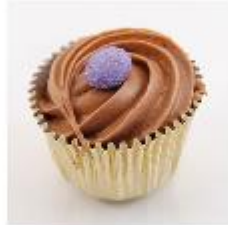
0130 Portugais Romige giandujarozet met hele griottine op likeur