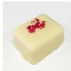
0037 Elba Zachte witte vulling