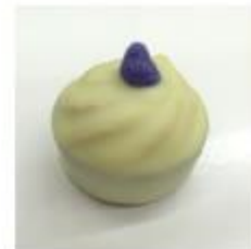
704 Canello Witte roomcrème met kaneel en kaneelgranulaat