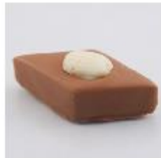
0058 Almond Melk amandelgianduja met chocolade amandel