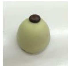
713 Cuba Pure roomcrème met rum