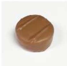
321 Arabica Melk hazelnoot- gianduja met koffie