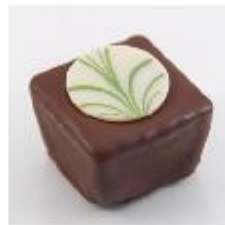
0126 Malibu Zachte vulling met cocos en cocosrasp