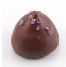
Kirschpunt mini Pure roomcrème met kirsch