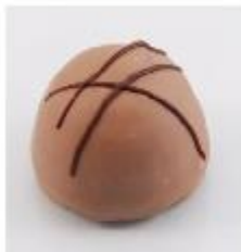
0002 Cognactips Pure roomcrème met cognac