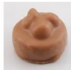
0059 Trois frères Melk gianduja met drie hele hazelnoten