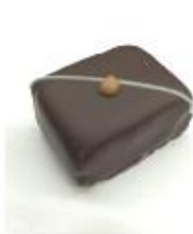
709 Roasted Almond Blokje van marspein, amandelspijs en stukjes walnoot