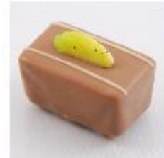
0031 Bahama Zachte vulling met banaan