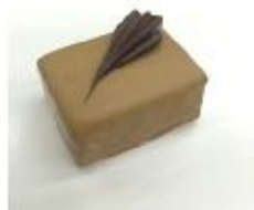
702 Cranberry rozijn Pure snijganache met cranberries en rozijnen