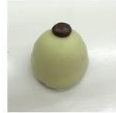
713 Cuba Pure roomcrème met rum