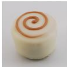
0024 Montelimar Pure chocoladevulling met plakje nougat