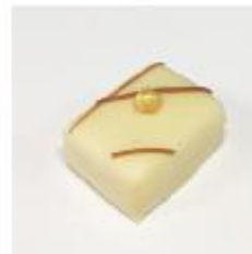
0038 Elvira Amandelmarsepein met maracuja