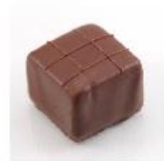
Koffie carree mini Pure vulling met koffie