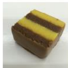
706 Duplo marsepein Blokje van maracuja- marsepein en chocolade marsepein