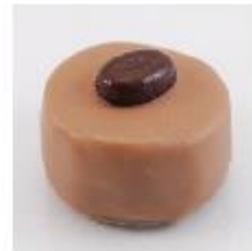
0035 Congo Melk hazelnootgianduja met koffiegranulaat