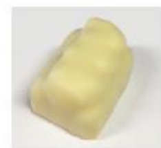
717 Naranja Marsepein met stukjes sinaasappel en sinaasappelcrème